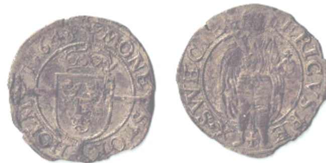
Rop Nr 19 1 Öre 1564 Erik XIV