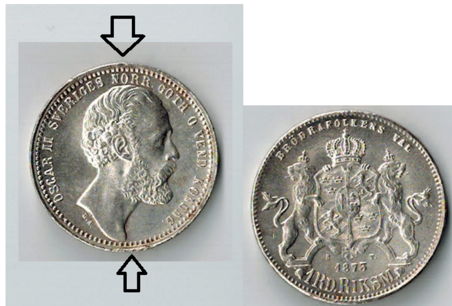
71 1 Riksdaler RM VM 1873 (8)