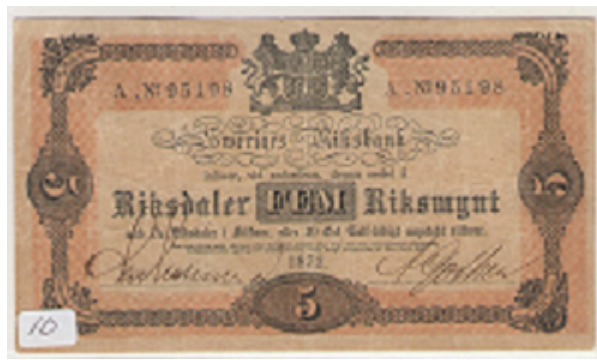
Rop Nr. 10 5 Riksdaler Riksmünt 1872