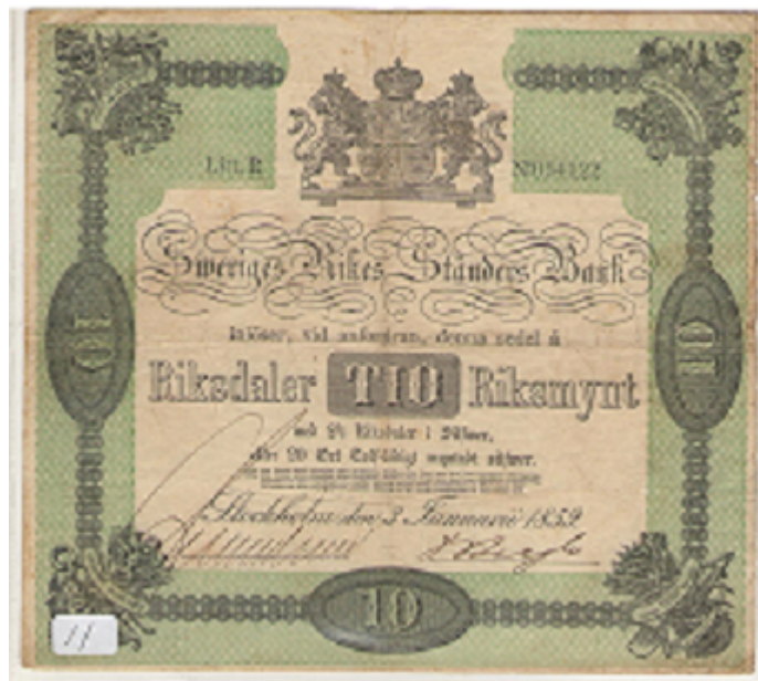
Rop Nr 11 10 Riksdaler Riksmünt 1859