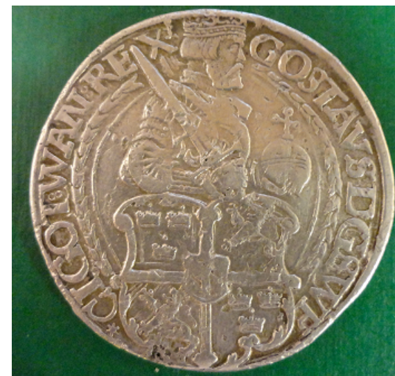
1 Daler Svartsjö 1543