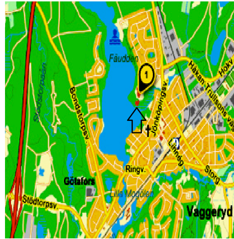
Byggnaden vid pilen