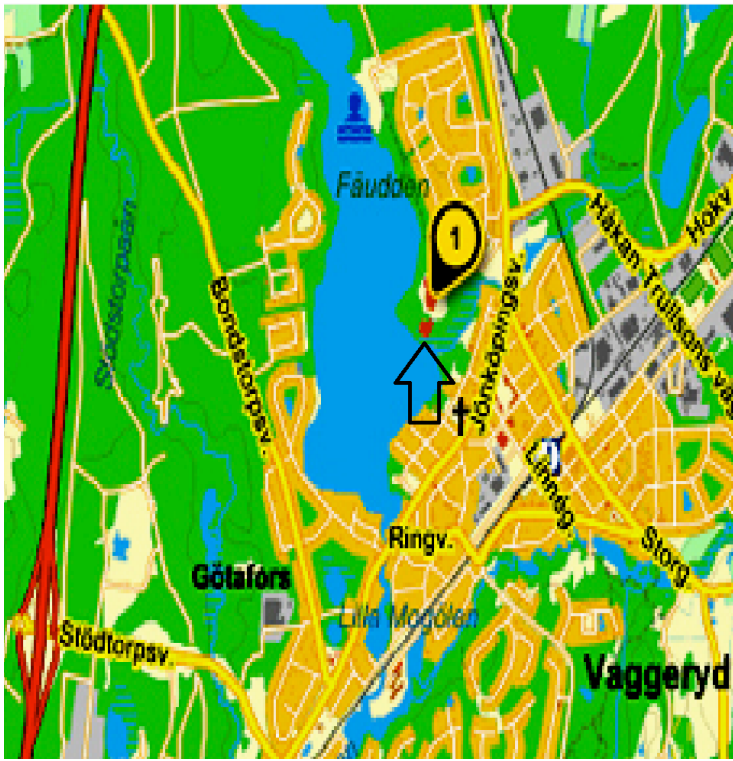
Byggnaden vid pilen