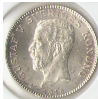
Nr 1 1Kr 1918 kv. 7,5 (1+/01 - 01)

(OBS! det är svårt att få till bra bilder som gör mynten rättvisa)