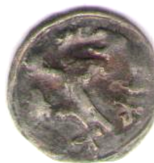
Nr 135 Brakteak ensidig Penning lejon Magnus Eriksson 1319 - 1363 Kv. 6 (1+)

Ibland kan det bli lite konstigt, så vitt jag kommer ihåg har vi aldrig haft med något lokalmynt från Öland men denna gång har vi med 4 st. 10 kr och 1 st. 100 kr!