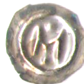
75 Brakteak Magnus Ladulås 1275 – 1290