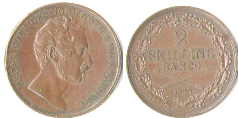
104 2 Skilling Banco 1844 brett huvud

Tag med objekt till nästa auktion i November och glöm ej att till Decembarmötet vill vi ha objekt till både december och januari för vi klassar det samtidigt p.g.a. att januarimötet är mycket tidigt.