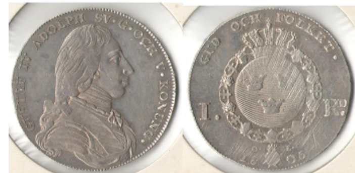
Nr 69 1 Riksdaler (plantrisor) 1805 Kv. 5-6