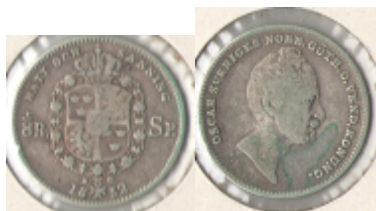
Nr 58 1/8 Riksdaler Specie 1852 Kv 2