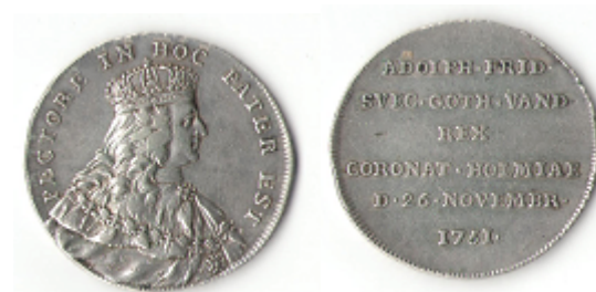
Nr. 67 2 Mark Kastmynt Adolf Fredrik kröning 1751 (puts) kv.5