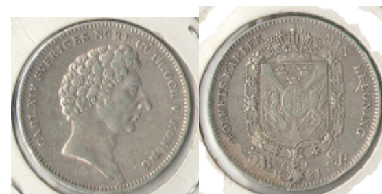
Nr. 63 ½ Riksdaler 1831 kv.5/4