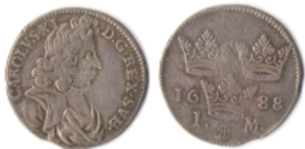
Nr 42. 1 Mark 1688 Kv. 4