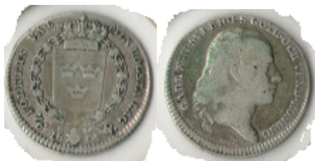
Nr. 48 1/6 Riksdaler 1814 Kv.2