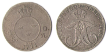
Nr 9 4 Öre (1/24 Rd.) typmynt 1771