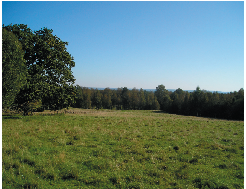
Vy över området

Syftet med detaljplanen är att skapa förutsättningar för nybyggnad av villabebyggelse. Områdets placering i västra Skillingaryd är positiv med hänsyn till dess närhet till dels centrum men även till mycket fina naturmiljöer.